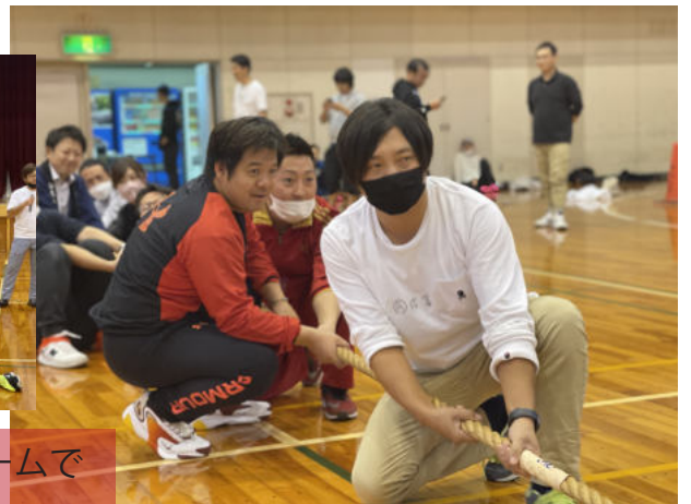
JCI唐津・JCI姫路混合チームで 大運動会！