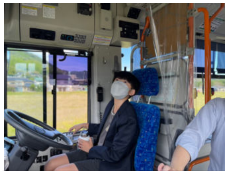
小さなバス運転手さん♪