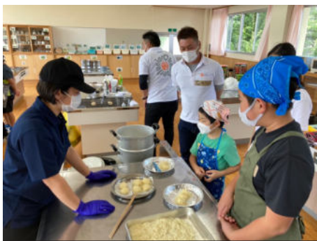
いかしゅうまいづくり体験