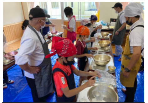
クッキーづくり体験