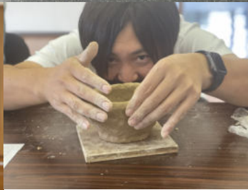
中野陶痴窯さんと器作り