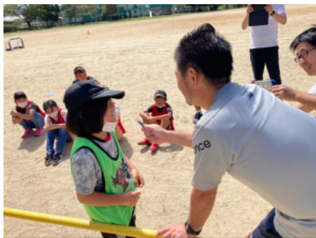
サッカー選手へインタビュー

9月24日（土）に今年度の青少年事業を行いました！佐志小学校全体をお借りし、中野陶痴窯様、成村建設(株)様、宮島醤油(株)様、唐津市消防本部様、昭和自動車(株)様、(株)サガン・ドリームス様、Hinodeya 様、(株)萬坊様にご協力いただき、皿作り体験、椅子づくり体験、味噌づくり体験、出動体験・放水体験、バス運転手体験、サッカー選手体験、お菓子づくり体験、いかしゅうまいづくり体験を子どもたちと一緒に行いました。小さなパティシエ、小さな消防士、サッカー選手と子どもたちが楽しみながら学べる体験をしてもらい、全力で取り組む姿に、私たちも笑顔溢れる体験となりました。また、地元の企業様にご協力いただくことで、からつにはこんな素晴らしい仕事がある！と子どもたちにも伝わったと思います。当日はもちろんのこと、事前準備と大変お世話になりました。