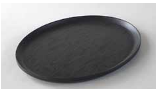
#126 OVAL TRAY 380×305×28mm