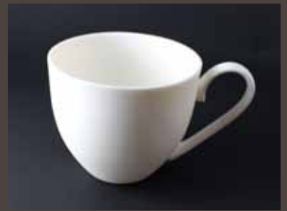
MG-2 MUQ CUP M