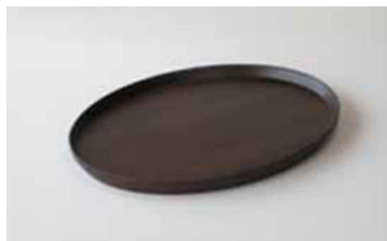
#614 OVAL TRAY 370×300×25mm