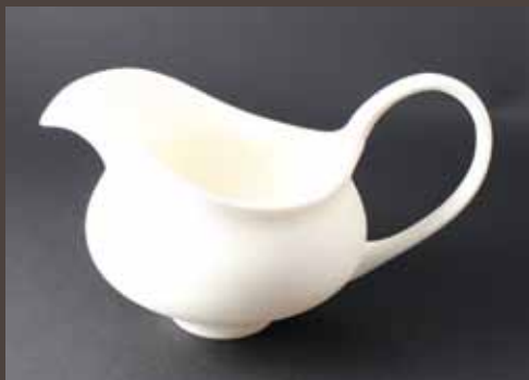
CT-2c Milk Pitcher