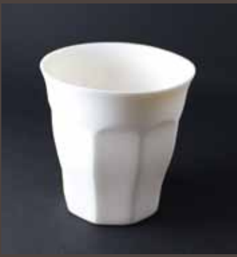
DR-1 DURA CUP S