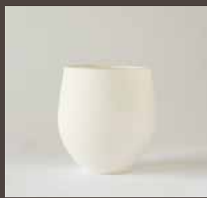
A-13 TAMAGO DEBU