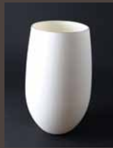
A-6 TAMAGO M