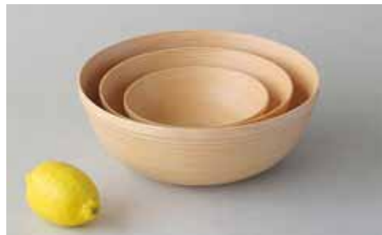
#261 BOWL 250×95mm