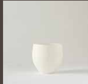
A-19 TAMAGO SS