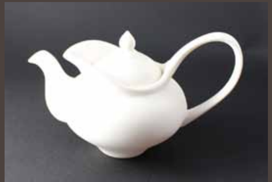
CT-1c Tea Pot