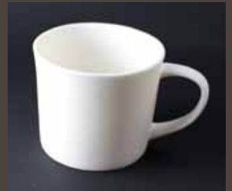
MG-1 MUQ CUP S