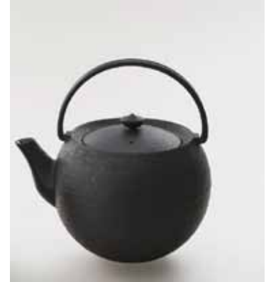
HS-52L ティーポット 丸玉 1.1 ㍓ ホワイト ¥ 19, 440