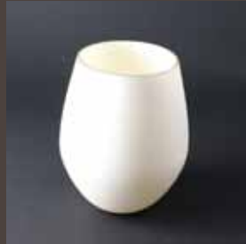
A-2 TAMAGO S