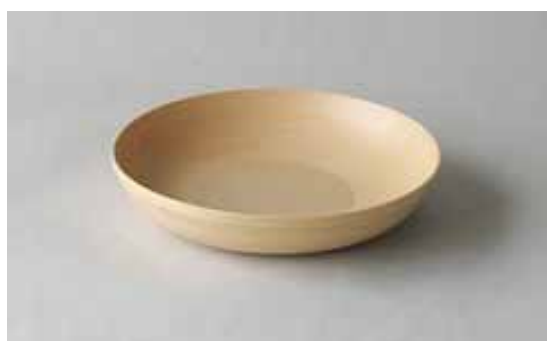
#266 BOWL 240×50mm