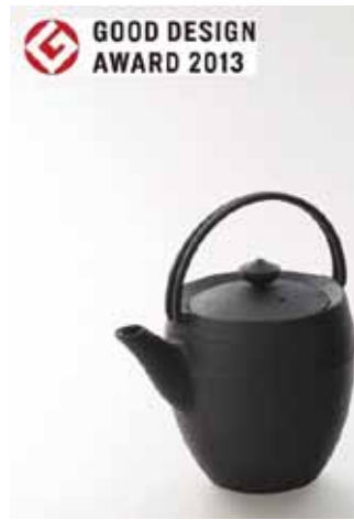
HS-51S ティーポット 丸筒 0.45 ㍓ ホワイト ¥ 10, 800 HS-51L ティーポット 丸筒 1.1 ㍓ ホワイト ¥ 19, 440

「鑄心ノ工房」は増田尚紀デザインによる日本に 伝わる鑄物の伝統美を、今日の生活様式に提案する CASTING STUDIO (鑄造物工場) です。 伝統工芸は本来は決して保守的なものではなく、 その時代においては極めて革新的な、 ハードとソフトを合わせたものです。 工芸が人々の暮らしに潤いを与える生活道具として、 今日性を持つことにより、新たな伝統は築かれます。 鑄心ノ工房は日本文化をリードとした鑄造品を 中心にユニバーサルなデザインを制作する 創造的工房です。