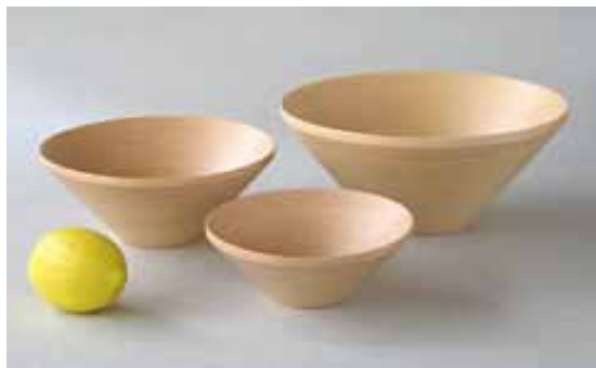
#264 BOWL 250×115mm