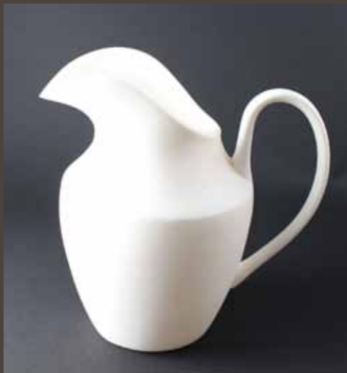
MP-2 Pot de lait M